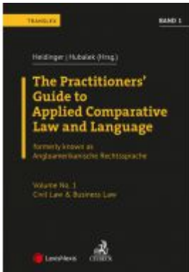
Angloamerikanische Rechtssprache / The Practitioners' Guide to Applied Comparative Law and Language Vol 1 Ladenpreis: 94,00 EUR