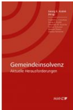
Gemeindeinsolvenz Ladenpreis: 54,00 EUR