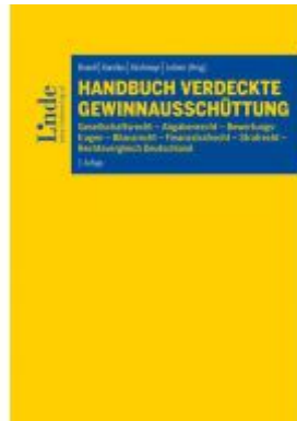
Handbuch Verdeckte Gewinnausschüttung Ladenpreis: 98,00 EUR