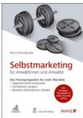
Selbstmarketing für Anwältinnen und Anwälte Das Fitnessprogramm für mehr Mandate Ladenpreis: 45,00EUR