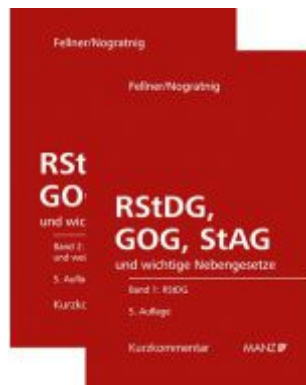
RStDG, GOG und StAG Richter- und StaatsanwaltschaftsdienstG, GerichtsorganisationsG und StaatsanwaltschaftsG Ladenpreis: 298,00EUR