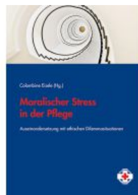
Moralischer Stress in der Pflege Ladenpreis: 14,90EUR