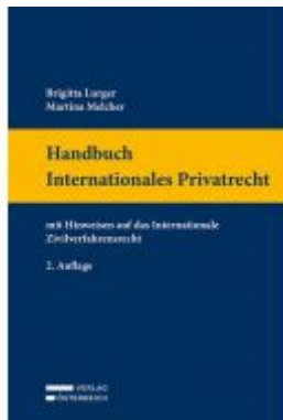
Handbuch Internationales Privatrecht Ladenpreis: 119,00EUR