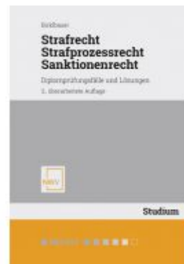
Strafrecht, Strafprozessrecht, Sanktionenrecht Ladenpreis: 32,00EUR