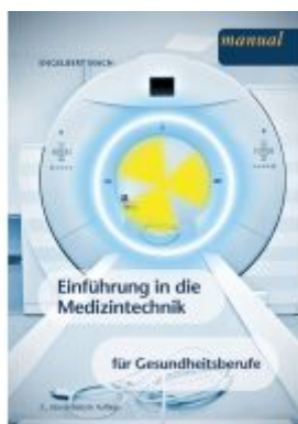
Einführung in die Medizintechnik für Gesundheitsberufe Ladenpreis: 29,90EUR