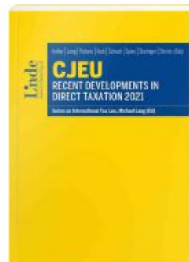
CJEU - Recent Developments in Direct Taxation 2021 Ladenpreis: 85,00EUR