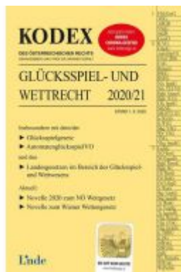
KODEX Glücksspiel- und Wettrecht 2020/21 Ladenpreis: 68,00 EUR