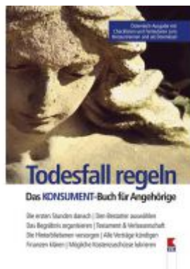
Todesfall regeln. Das KONSUMENT-Buch für Angehörige Ladenpreis: 19,90 EUR