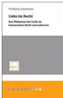
Liebe im Recht Ladenpreis: 48,00 EUR