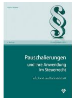
Pauschalierungen und ihre Anwendung im Steuerrecht inkl. Land- und Forstwirtschaft Ladenpreis: 39,60 EUR