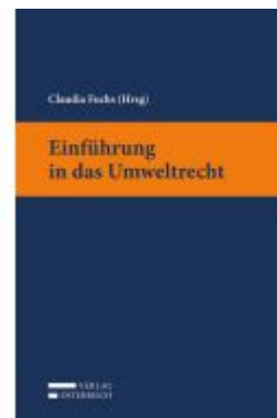
Einführung in das Umweltrecht Ladenpreis: 28,00 EUR