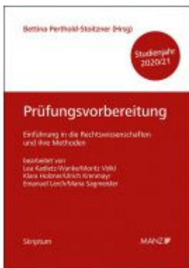
Prüfungsvorbereitung Einführung in die Rechtswissenschaften und ihre Methoden Ladenpreis: 19,00 EUR

Wir haben andere Produkte gefunden, die Ihnen gefallen könnten!