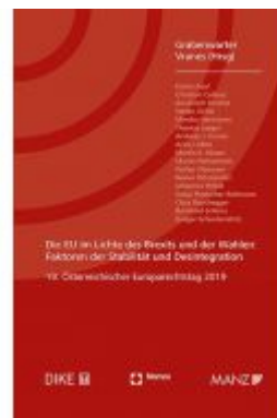
Die EU im Lichte des Brexits und der Wahlen Europarechtstag 2019 Ladenpreis: 58,00 EUR