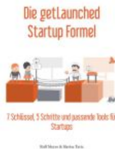
Die getLaunched Startup Formel Ladenpreis: 59,00EUR