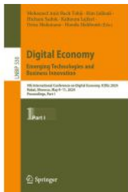
Digital Economy. Emerging Technologies and Business Innovation Ladenpreis: 142,99EUR