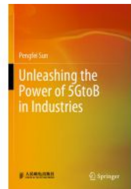
Unleashing the Power of 5GtoB in Industries Ladenpreis: 120,99EUR