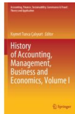
History of Accounting, Management, Business and Economics, Volume I Ladenpreis: 197,99EUR