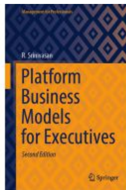
Platform Business Models for Executives Ladenpreis: 87,99EUR