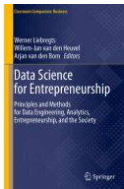
Data Science for Entrepreneurship Ladenpreis: 65,99EUR