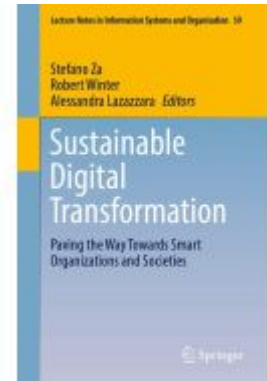
Sustainable Digital Transformation Ladenpreis: 197,99EUR