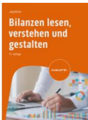
Bilanzen lesen, verstehen und gestalten Ladenpreis: 41,20EUR