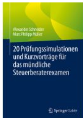
20 Prüfungssimulationen und Kurzvorträge für das mündliche Steuerberaterexamen Ladenpreis: 25,69EUR