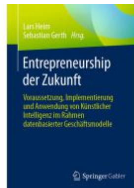
Entrepreneurship der Zukunft Ladenpreis: 51,39EUR