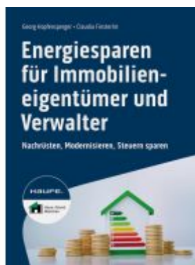
Energiesparen für Immobilieneigentümer und Verwalter Ladenpreis: 41,20EUR