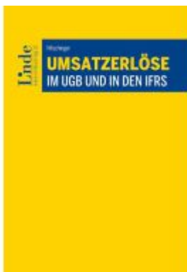
Umsatzerlöse im UGB und in den IFRS Ladenpreis: 78,00EUR