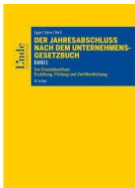
Der Jahresabschluss nach dem Unternehmensgesetzbuch, Band 1 Ladenpreis: 78,00EUR

Wir haben andere Produkte gefunden, die Ihnen gefallen könnten!