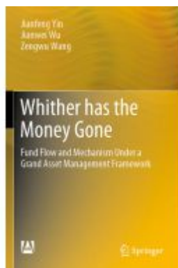
Whither has the Money Gone Ladenpreis: 131,99EUR