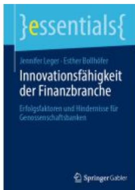
Innovationsfähigkeit der Finanzbranche Ladenpreis: 15,41EUR