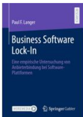
Business Software Lock-In Ladenpreis: 102,80EUR