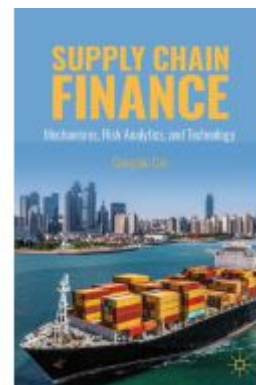
Supply Chain Finance Ladenpreis: 109,99EUR