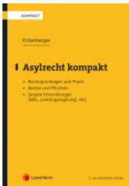
Asylrecht kompakt Ladenpreis: 34,00 EUR