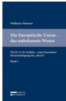
Die Europäische Union - das unbekannte Wesen Ladenpreis: 54,00 EUR