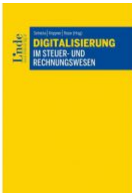
Digitalisierung im Steuer- und Rechnungswesen Ladenpreis: 79,00 EUR