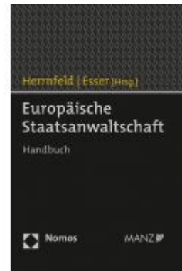
Europäische Staatsanwaltschaft Ladenpreis: 98,00 EUR