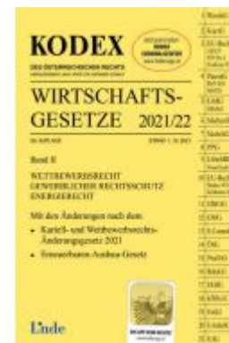
KODEX Wirtschaftsgesetze Band II 2021/22 Ladenpreis: 60,00 EUR