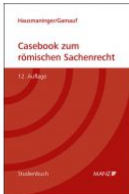
Casebook zum römischen Sachenrecht Ladenpreis: 37,00 EUR