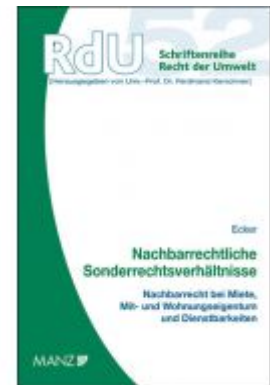
Nachbarrechtliche Sonderrechtsverhältnisse Ladenpreis: 54,00 EUR