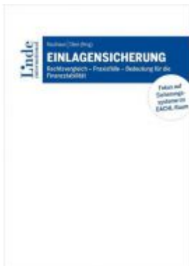
Einlagensicherung Ladenpreis: 98,00 EUR