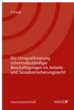
Die Umqualifizierung scheinselfständiger Beschäftigten im Arbeits- und Sozialversicherungsrecht Ladenpreis: 56,00 EUR