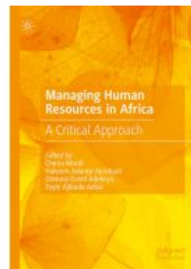
Managing Human Resources in Africa Ladenpreis: 186,99EUR