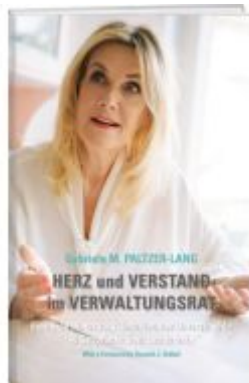
Herz und Verstand im Verwaltungsrat Ladenpreis: 49,00EUR