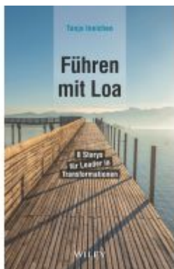
Führen mit Loa Ladenpreis: 25,70EUR