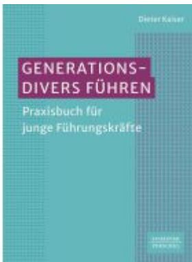
Generationsdivers führen Ladenpreis: 41,20EUR

Wir haben andere Produkte gefunden, die Ihnen gefallen könnten!