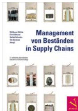
Management von Beständen in Supply Chains Ladenpreis: 59,00EUR