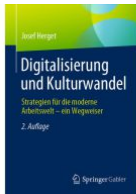
Digitalisierung und Kulturwandel Ladenpreis: 41,11EUR