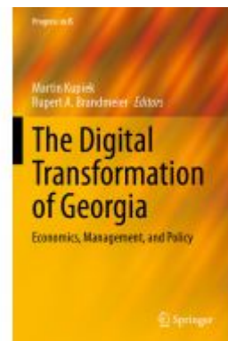
The Digital Transformation of Georgia Ladenpreis: 65,99EUR