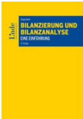
Bilanzierung und Bilanzanalyse Ladenpreis: 58,00EUR