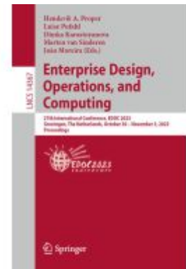
Enterprise Design, Operations, and Computing Ladenpreis: 71,49EUR