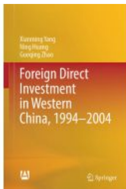
Foreign Direct Investment in Western China, 1994-2004 Ladenpreis: 142,99EUR