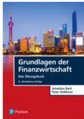
Grundlagen der Finanzwirtschaft Ladenpreis: 34,95EUR