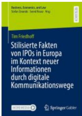
Stilisierte Fakten von IPOs in Europa im Kontext neuer Informationen durch digitale Kommunikationswege Ladenpreis: 82,23EUR