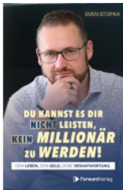
Du kannst es dir nicht leisten, kein Millionär zu werden Ladenpreis: 20,00EUR