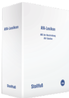
AfA-Lexikon Ladenpreis: 136,40EUR