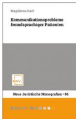
Kommunikationsprobleme fremdsprachiger Patienten Ladenpreis: 58,00 EUR