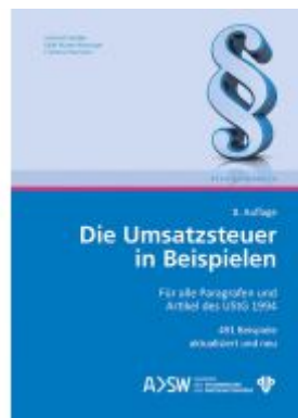
Die Umsatzsteuer in Beispielen Ladenpreis: 59,00 EUR