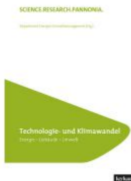
Technologie und Klimawandel (FH Burgenland Bd. 22)