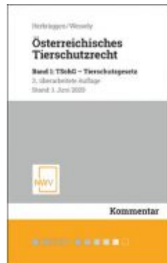
Österreichisches Tierschutzrecht Ladenpreis: 98,00 EUR