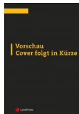
Praxishandbuch Veranstaltungsrecht + Update