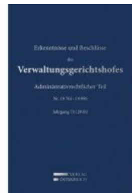
Erkenntnisse und Beschlüsse des Verwaltungsgerichtshofes Ladenpreis: 476,00 EUR