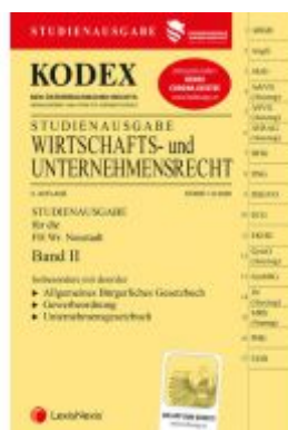
KODEX Wirtschafts- und Unternehmensrecht 2020 Band II