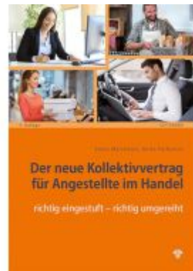
Der neue Kollektivvertrag für Angestellte im Handel Ladenpreis: 36,75 EUR