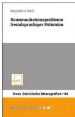
Kommunikationsprobleme fremdsprachiger Patienten Ladenpreis: 58,00 EUR