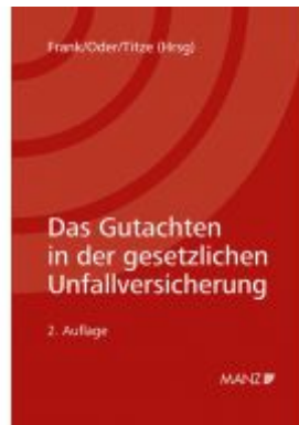
Das Gutachten in der gesetzlichen Unfallversicherung Ladenpreis: 78,00 EUR