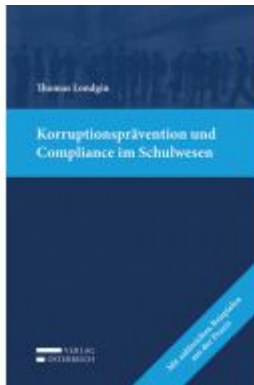
Korruptionsprävention und Compliance im Schulwesen Ladenpreis: 39,00 EUR