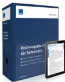
Rechnungsabschluss der Gemeinden Ladenpreis: 207,90 EUR