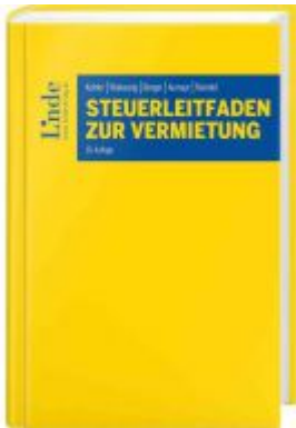
Steuerleitfaden zur Vermietung Ladenpreis: 98,00 EUR