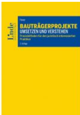
Bauträgerprojekte umsetzen und verstehen Ladenpreis: 52,00 EUR