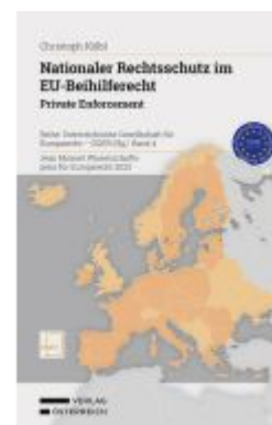
Nationaler Rechtsschutz im EU- Beihilferecht