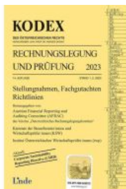
KODEX Rechnungslegung und Prüfung 2023