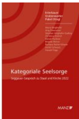
Kategoriale Seelsorge Seggauer Gespräch zu Staat und Kirche 2022 Ladenpreis: 28,00EUR