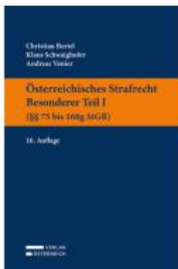
Österreichisches Strafrecht. Besonderer Teil I (§§ 75 bis 168g StGB) Ladenpreis: 39,00EUR