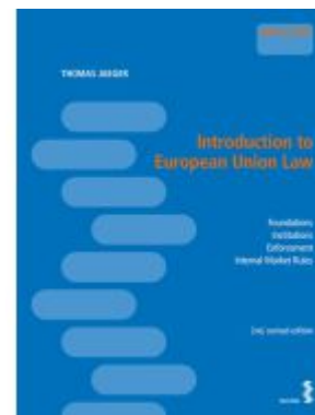
Introduction to European Law