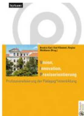
Vision Innovation Praxisorientierung Professionalisierung der Pädagog*innenbildung Ladenpreis: 35,00EUR