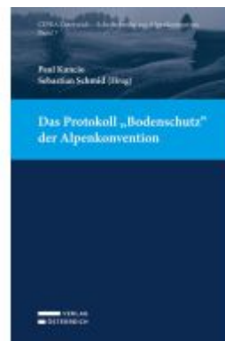
Das Protokoll „Bodenschutz“ der Alpenkonvention Ladenpreis: 45,00EUR