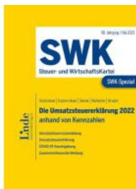
SWK-Spezial Die Umsatzsteuererklärung 2022