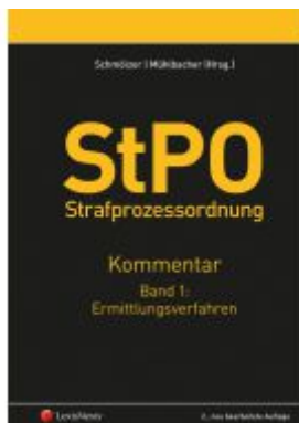
StPO Strafprozessordnung - Kommentar Band 1: Ermittlungsverfahren Ladenpreis: 292,00 EUR