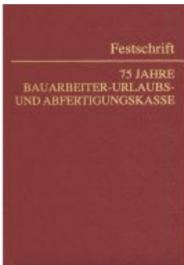
75 Jahre Bauarbeiter-Urlaubs- und Abfertigungskasse Ladenpreis: 59,00 EUR