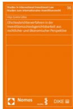
Eilschiedsrichterverfahren in der Investitionsschiedsgerichtsbarkeit aus rechtlicher und ökonomischer Perspektive Ladenpreis: 74,00 EUR