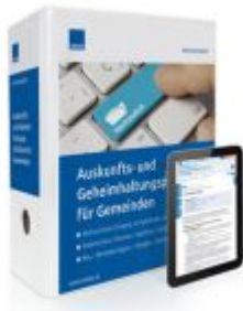
Auskunfts- und Geheimhaltungspflichten für Gemeinden Ladenpreis: 217,80 EUR