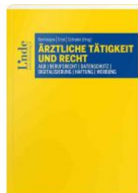
Ärztliche Tätigkeit und Recht Ladenpreis: 48,00 EUR