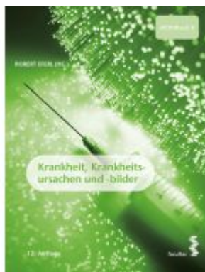
Krankheit, Krankheitsursachen und -bilder Ladenpreis: 34,90 EUR