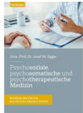
Psychosoziale, psychosomatische und psychotherapeutische Medizin Ladenpreis: 39,00 EUR