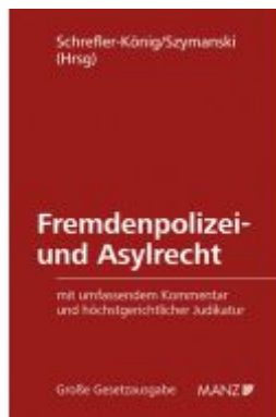
Fremdenpolizei- und Asylrecht Ladenpreis: 235,00 EUR