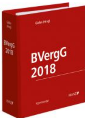
BVerGG 2018 Ladenpreis: 258,00 EUR