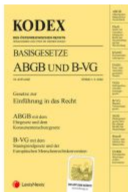
KODEX Basisgesetze ABGB und B-VG 2022 - inkl. App Ladenpreis: 15,00 EUR