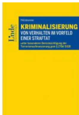
Kriminalisierung von Verhalten im Vorfeld einer Straftat Ladenpreis: 39,00 EUR