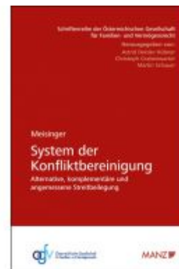
System der Konfliktbereinigung Ladenpreis: 48,00 EUR