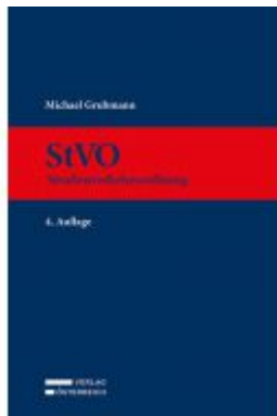
StVO Ladenpreis: 349,00 EUR