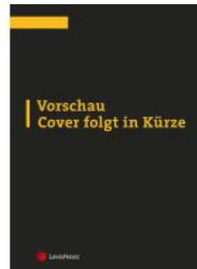
Kommentar zum AVG Aktionspreis: 184,00 EUR Ladenpreis: 230,00 EUR