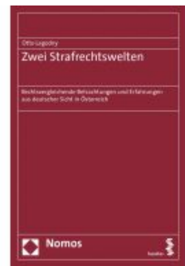
Zwei Strafrechtswelten Ladenpreis: 60,70 EUR