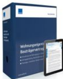
Wohnungseigentum und Bauträgervertragsrecht Ladenpreis: 239,80 EUR