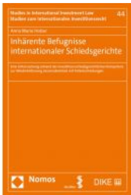
Inhärente Befugnisse internationaler Schiedsgerichte Ladenpreis: 112,10 EUR