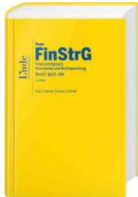
FinStrG | Finanzstrafgesetz Ladenpreis: 220,00 EUR