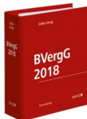
BVergG 2018 Ladenpreis: 258,00 EUR