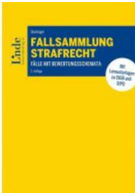
Fallsammlung Strafrecht Ladenpreis: 42,00 EUR