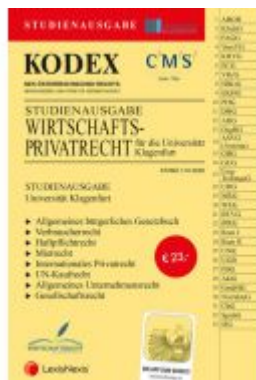
KODEX Wirtschaftsprivatrecht Klausenfurt Ladenpreis: 23,00 EUR

Wir haben andere Produkte gefunden, die Ihnen gefallen könnten!