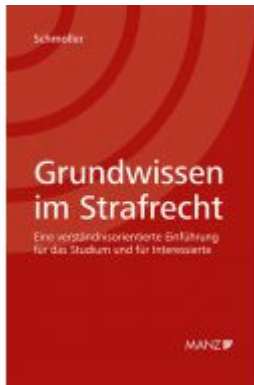
Grundwissen im Strafrecht Ladenpreis: 34,00 EUR