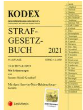
Taschen-Kodex Strafgesetzbuch 2021 Ladenpreis: 15,00 EUR