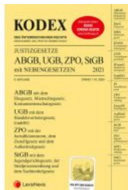
KODEX Justizgesetze 2021 Ladenpreis: 29,00 EUR