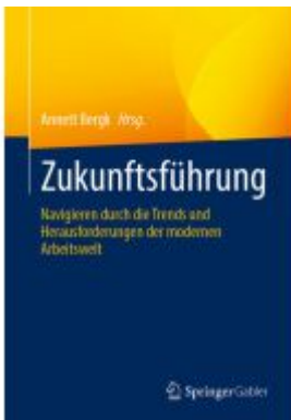
Zukunftsführung Ladenpreis: 51,39EUR