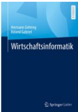
Wirtschaftsinformatik Ladenpreis: 56,53EUR