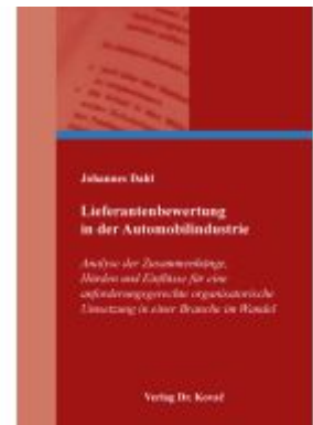
Lieferantenebewertung in der Automobilindustrie Ladenpreis: 102,60EUR