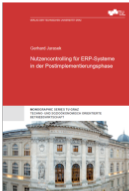
Nutzencontrolling für ERP-Systeme in der Postimplementierungsphase Ladenpreis: 36,00EUR