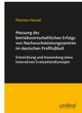
Messung des betriebswirtschaftlichen Erfolgs von Nachwuchsleistungszentren im deutschen Profifußball Ladenpreis: 19,00EUR