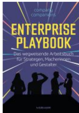
Enterprise Playbook Ladenpreis: 40,10EUR