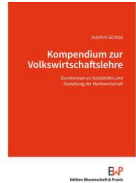
Kompendium zur Volkswirtschaftslehre Ladenpreis: 82,20EUR