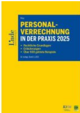
Personalverrechnung in der Praxis 2025 Ladenpreis: 124,00EUR

Wir haben andere Produkte gefunden, die Ihnen gefallen könnten!