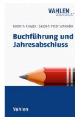
Buchführung und Jahresabschluss Ladenpreis: 23,60EUR