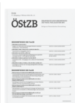
ÖstZB Zeitschrift - Jahres-Abonnement (24 Hefte) Ladenpreis: 0,00EUR