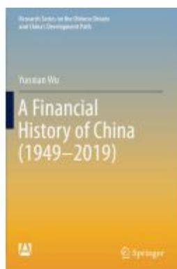
A Financial History of China (1949–2019) Ladenpreis: 131,99EUR