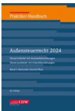
Praktiker-Handbuch Außensteuerrecht 2024, 2 Bde., 48.A. Ladenpreis: 112,10EUR