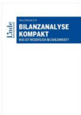
Bilanzanalyse kompakt Ladenpreis: 38,00EUR