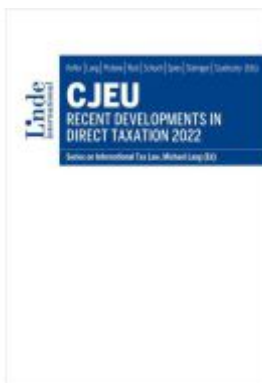
CJEU - Recent Developments in Direct Taxation 2022 Ladenpreis: 85,00EUR