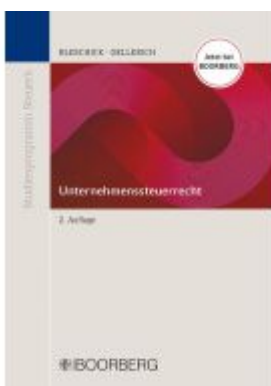
Unternehmenssteuerrecht Ladenpreis: 29,90EUR