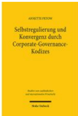
Selbstregulierung und Konvergenz durch Corporate-Governance-Kodizes Ladenpreis: 107,00EUR