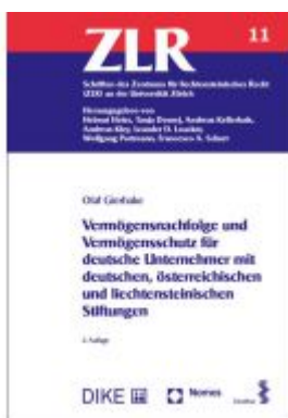
Vermögensnachfolge und Vermögensschutz für deutsche Unternehmer mit deutschen, österreichischen und liechtensteinischen Stiftungen Ladenpreis: 88,40 EUR