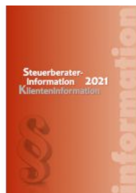
Steuerberaterinformation 2021 Klienteninformation Ladenpreis: 44,90 EUR