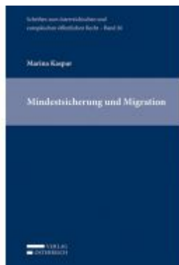
Mindestsicherung und Migration Ladenpreis: 79,00 EUR

Wir haben andere Produkte gefunden, die Ihnen gefallen könnten!