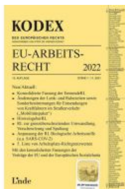
KODEX EU-Arbeitsrecht 2022 Ladenpreis: 69,00 EUR