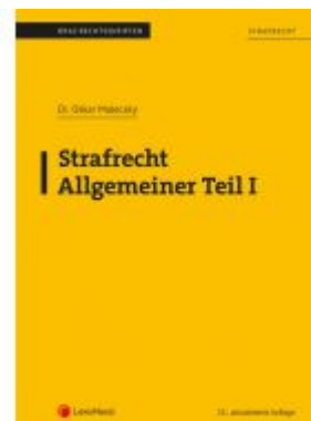
Strafrecht - Allgemeiner Teil I (Skriptum) Ladenpreis: 17,00 EUR