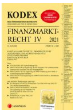
KODEX Finanzmarktrecht Band IV 2021 Ladenpreis: 81,00 EUR