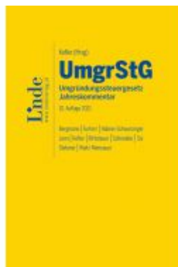
UmgrStG | Umgründungssteuergesetz 2021 Ladenpreis: 245,00 EUR