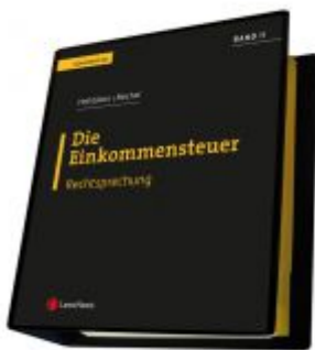
Die Einkommensteuer (EStG 1988) Band II - Rechtsprechung Ladenpreis: 295,00 EUR