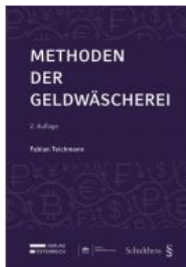
Methoden der Geldwäscherei Ladenpreis: 115,00 EUR