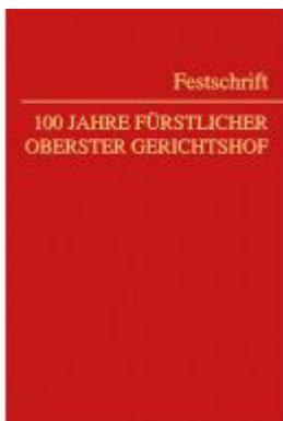
100 Jahre Fürstlicher Oberster Gerichtshof Ladenpreis: 110,00 EUR