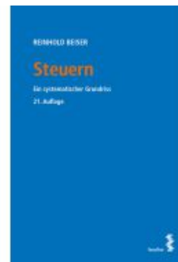
Steuern Ladenpreis: 50,00EUR