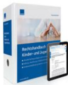
Rechtshandbuch Kinder- und Jugendschutz Ladenpreis: 239,80EUR