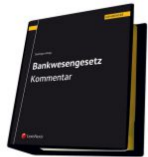
Bankwesengesetz - BWG Kommentar Ladenpreis: 548,00 EUR