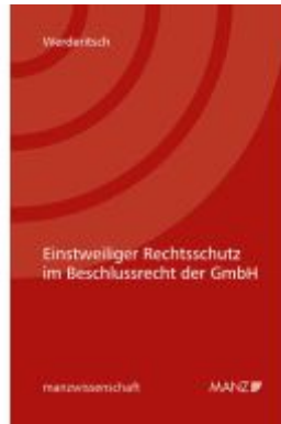
Einstweiliger Rechtsschutz im Beschlussrecht der GmbH Ladenpreis: 48,00EUR