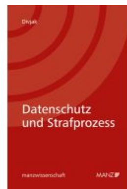
Datenschutz und Strafprozess Ladenpreis: 48,00EUR