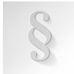
PAKET: Zivilprozessrecht 3.Auflage+ Zivilprozessrecht Schaubilder und Aktenmuster 14.Auflage+ Exekutions-und InsolvenzR 12.Auflage Ladenpreis: 123,30 EUR