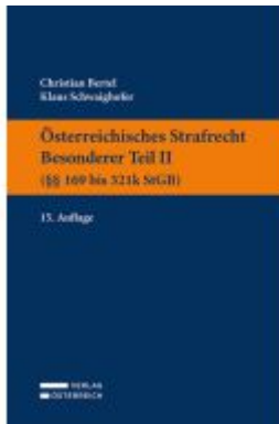
Österreichisches Strafrecht. Besonderer Teil II (§§ 169 bis 321k StGB) Ladenpreis: 39,00EUR