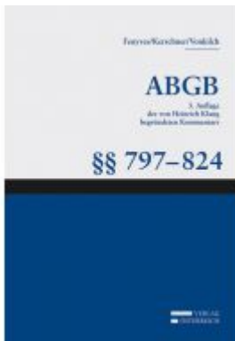
Großkommentar zum ABGB - Klang Kommentar Ladenpreis: 145,00 EUR

Wir haben andere Produkte gefunden, die Ihnen gefallen könnten!