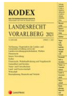
KODEX Landesrecht Vorarlberg 2021 Ladenpreis: 115,00 EUR