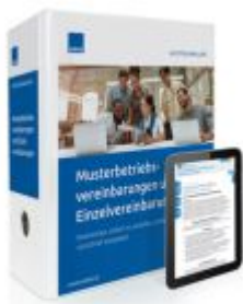
Musterbetriebsvereinbarungen und Einzelvereinbarungen Ladenpreis: 239,80EUR

Wir haben andere Produkte gefunden, die Ihnen gefallen könnten!