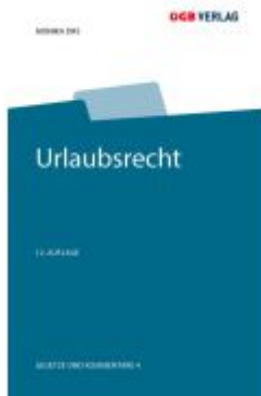
Urlaubsrecht Ladenpreis: 109,00EUR