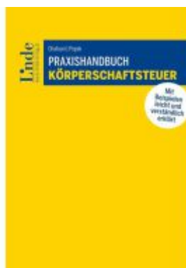
Praxishandbuch Körperschaftsteuer Ladenpreis: 59,00EUR