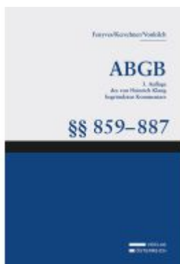
Großkommentar zum ABGB - Klang Kommentar Ladenpreis: 544,00EUR