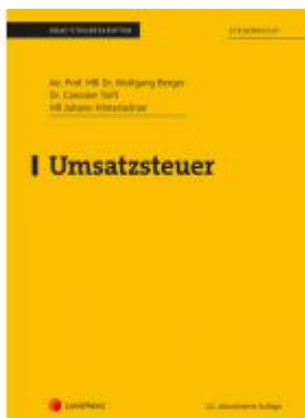
Umsatzsteuer (Skriptum) Ladenpreis: 28,00 EUR