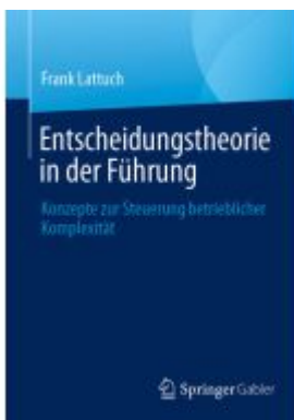
Entscheidungstheorie in der Führung