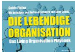
Die lebendige Organisation Ladenpreis: 36,00EUR