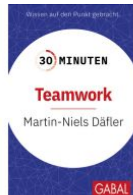
30 Minuten Teamwork