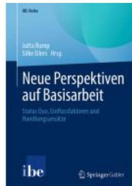
Neue Perspektiven auf Basisarbeit Ladenpreis: 61,67EUR