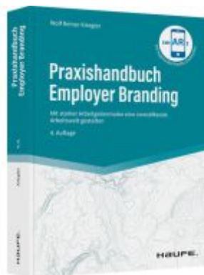
Praxishandbuch Employer Branding