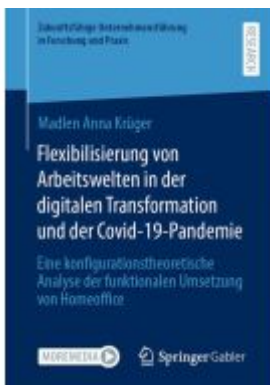
Flexibilisierung von Arbeitswelten in der digitalen Transformation und der Covid-19-Pandemie