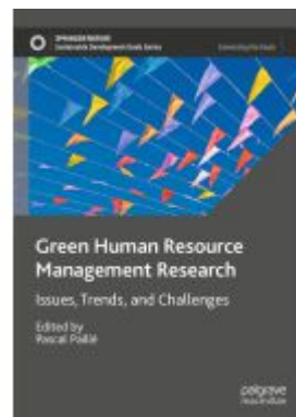
Green Human Resource Management Research Ladenpreis: 120,99EUR