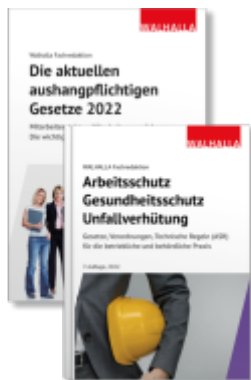
Kombi-Paket Die aktuellen aushangspflichtigen Gesetze + Arbeitsschutz, Gesundheitsschutz, Unfallverhütung 2025 Ladenpreis: 30,80EUR