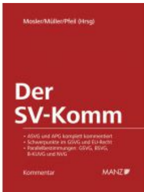
Der SV-Komm Ladenpreis: 398,00 EUR