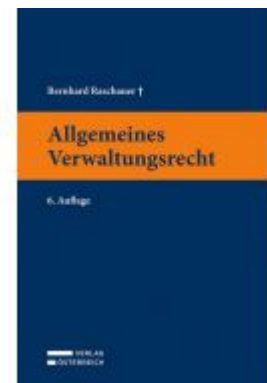
Allgemeines Verwaltungsrecht Ladenpreis: 49,00 EUR