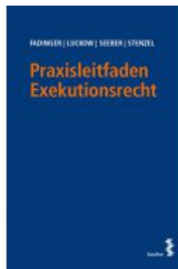
Praxisleitfaden Exekutionsrecht Ladenpreis: 36,00 EUR