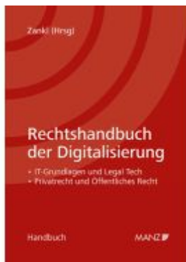
Rechtshandbuch der Digitalisierung Ladenpreis: 118,00EUR