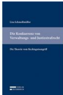
Die Konkurrenz von Verwaltungs- und Justizstrafrecht Ladenpreis: 79,00 EUR