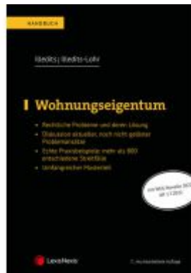
Wohnungseigentum Ladenpreis: 99,00EUR