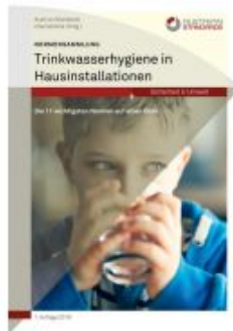
Normensammlung Trinkwasserhygiene in Hausinstallationen Ladenpreis: 174,90 EUR