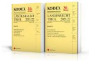
KODEX Landesrecht Tirol 2021 Ladenpreis: 128,00 EUR