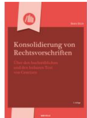
Konsolidierung von Rechtsvorschriften Ladenpreis: 36,00EUR