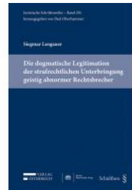
Die dogmatische Legitimation der strafrechtlichen Unterbringung abnormer Rechtsbrecher Ladenpreis: 79,00 EUR