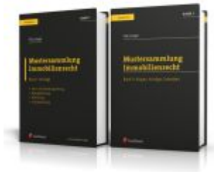
PAKET: Mustersammlung Immobilienrecht Ladenpreis: 88,80EUR