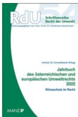
Jahrbuch des österreichischen und europäischen Umweltrechts 2022 Ladenpreis: 58,00EUR