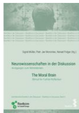
Neurowissenschaften in der Diskussion/Neurosciences in discussion Ladenpreis: 24,90EUR