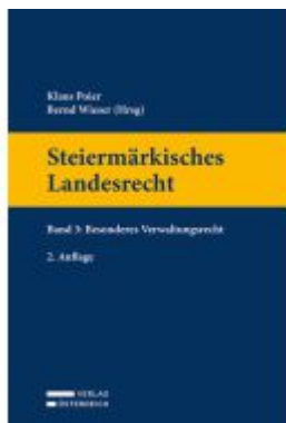
Steiermärkisches Landesrecht Ladenpreis: 99,00EUR