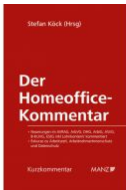
Der Homeoffice-Kommentar Ladenpreis: 68,00 EUR