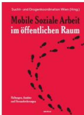
Mobile Soziale Arbeit im öffentlichen Raum Ladenpreis: 29,90EUR