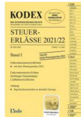
KODEX Steuer-Erlässe 2021/22, Band I Ladenpreis: 60,00 EUR