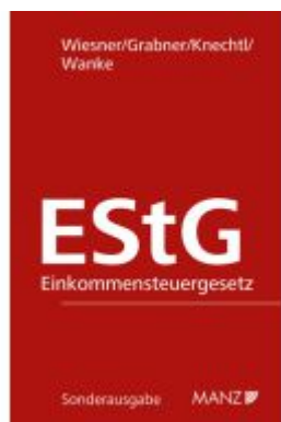
Einkommensteuergesetz EStG Ladenpreis: 448,00EUR