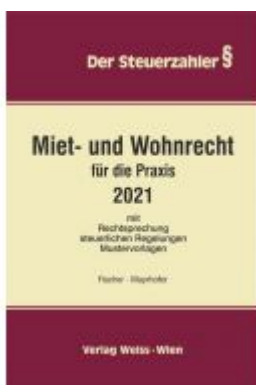
Miet- und Wohnrecht für die Praxis Ladenpreis: 69,30EUR