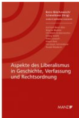
Aspekte des Liberalismus in Geschichte, Verfassung und Rechtsordnung Ladenpreis: 34,00EUR

Wir haben andere Produkte gefunden, die Ihnen gefallen könnten!