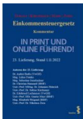
Einkommensteuergesetz Ladenpreis: 140,00EUR