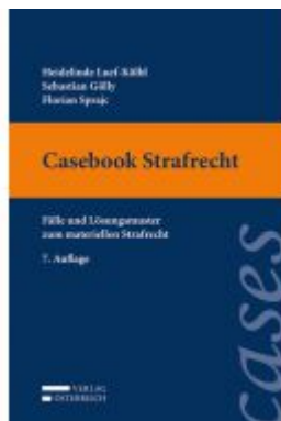
Casebook Strafrecht Ladenpreis: 36,00EUR