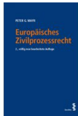
Europäisches Zivilprozessrecht Ladenpreis: 58,00EUR