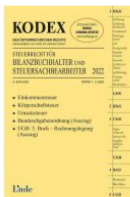
KODEX Steuerrecht für Bilanzbuchhalter und Steuersachbearbeiter 2022 Ladenpreis: 49,00EUR