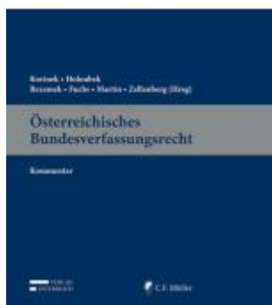
Österreichisches Bundesverfassungsrecht Ladenpreis: 329,00EUR