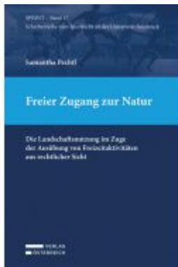
Freier Zugang zur Natur Ladenpreis: 79,00EUR