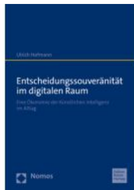
Entscheidungssouveränität im digitalen Raum Ladenpreis: 35,00EUR