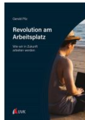
Revolution am Arbeitsplatz Ladenpreis: 30,90EUR