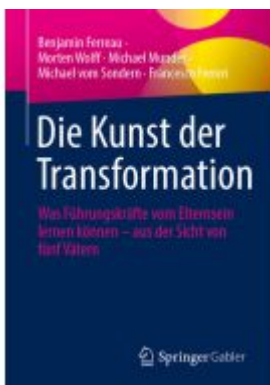
Die Kunst der Transformation Ladenpreis: 35,97EUR