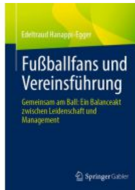
Fußballfans und Vereinsführung Ladenpreis: 46,25EUR