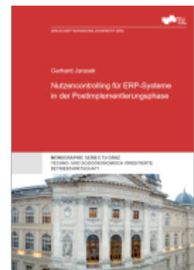
Nutzencontrolling für ERP-Systeme in der Postimplementierungsphase Ladenpreis: 36,00EUR