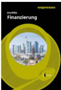
Finanzierung Ladenpreis: 22,70EUR