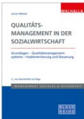
Qualitätsmanagement in der Sozialwirtschaft Ladenpreis: 36,00EUR