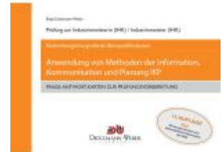
Industriemeister - Frage-Antwort- Lernkarten: Information, Kommunikation und Planung IKP Ladenpreis: 39,50EUR