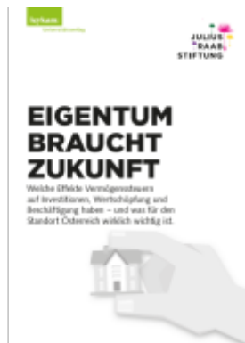
EIGENTUM BRAUCHT ZUKUNFT Ladenpreis: 35,00EUR