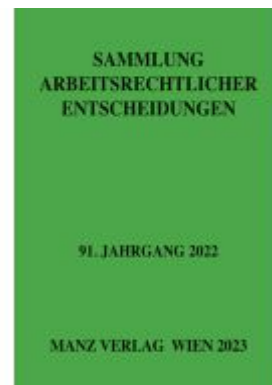
Sammlung arbeitsrechtlicher Entscheidungen Ladenpreis: 266,00EUR