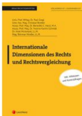
Internationale Dimensionen des Rechts und Rechtsvergleichung Ladenpreis: 21,50EUR