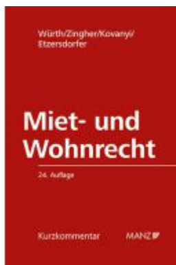
PAKET: Miet- und Wohnrecht 24. Auflage Ladenpreis: 258,00EUR