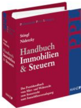
Handbuch Immobilien & Steuern Ladenpreis: 198,00EUR

Wir haben andere Produkte gefunden, die Ihnen gefallen könnten!