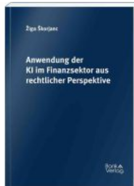
Anwendung der KI im Finanzsektor aus rechtlicher Perspektive Ladenpreis: 69,00EUR