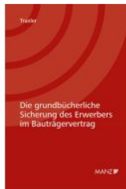
Die grundbücherliche Sicherung des Erwerbers im Bauträgervertrag Ladenpreis: 44,00EUR