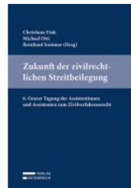
Zukunft der zivilrechtlichen Streitbeilegung Ladenpreis: 59,00EUR