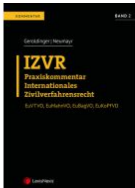
IZVR Praxiskommentar Internationales Zivilverfahrensrecht Ladenpreis: 139,00 EUR