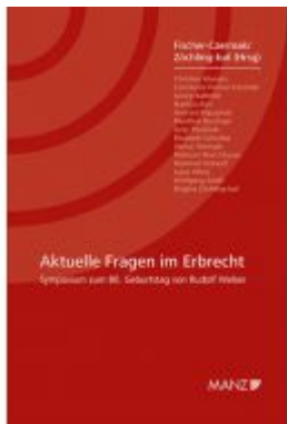
Aktuelle Fragen im Erbrecht Symposium zum 80. Geburtstag von Rudolf Welsch Ladenpreis: 34,80 EUR

Wir haben andere Produkte gefunden, die Ihnen gefallen könnten!