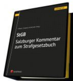
Salzburger Kommentar zum Strafgesetzbuch Ladenpreis: 498,00 EUR