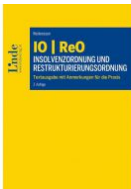
IO | ReO Insolvenzordnung und Restrukturierungsordnung Ladenpreis: 89,00 EUR