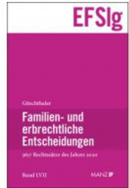
Familien- und erbrechtliche Entscheidungen EF-Slg Ladenpreis: 248,00 EUR