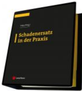
Schadenersatz in der Praxis Ladenpreis: 299,00 EUR