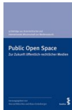
Public Open Space Ladenpreis: 24,00 EUR