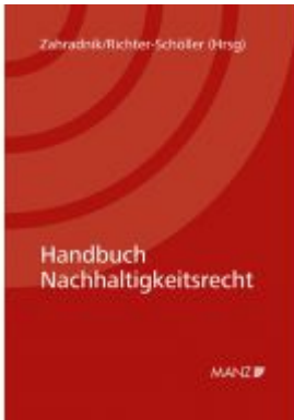
Handbuch Nachhaltigkeitsrecht Ladenpreis: 78,00 EUR