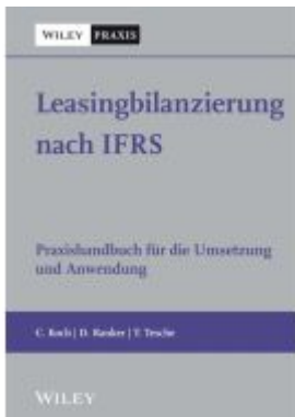
Leasingbilanzierung nach IFRS Ladenpreis: 51,30EUR

Wir haben andere Produkte gefunden, die Ihnen gefallen könnten!