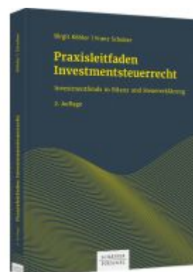
Praxisleitfaden Investmentsteuerrecht Ladenpreis: 102,80EUR