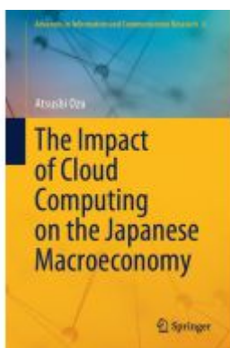
The Impact of Cloud Computing on the Japanese Macroeconomy Ladenpreis: 142,99EUR