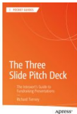
The Three Slide Pitch Deck Ladenpreis: 25,29EUR