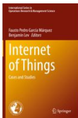
Internet of Things Ladenpreis: 71,49EUR