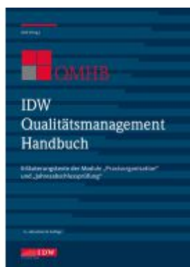
IDW Qualitätsmanagement Handbuch (QMHB) Ladenpreis: 56,60EUR