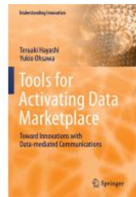
Tools for Activating Data Marketplace Ladenpreis: 164,99EUR