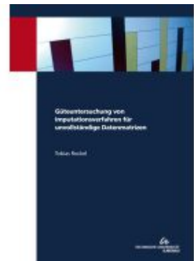
Güteuntersuchung von Imputationsverfahren für unvollständige Datenmatrizen Ladenpreis: 25,70EUR