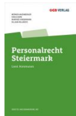
Personalrecht Steiermark Ladenpreis: 98,00 EUR