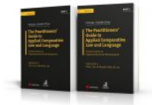
Angloamerikanische Rechtssprache / PAKET: The Practitioner's Guide to Applied Comparative Law and Language Ladenpreis: 142,00 EUR