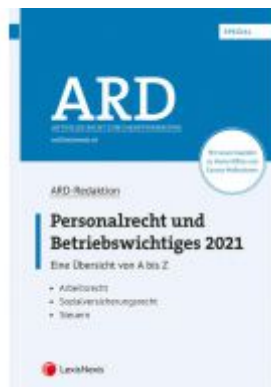
Personalrecht und Betriebswichtiges 2021 Ladenpreis: 80,00 EUR