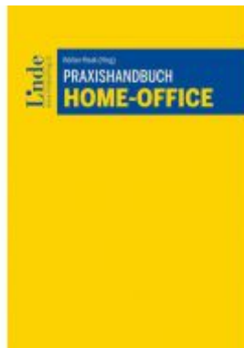
Praxishandbuch Home-Office Ladenpreis: 49,00 EUR