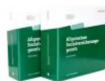
Allgemeines Sozialversicherungsgesetz Ladenpreis: 128,00 EUR