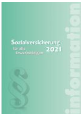
Sozialversicherung 2021 Ladenpreis: 44,90 EUR

Wir haben andere Produkte gefunden, die Ihnen gefallen könnten!