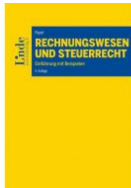
Rechnungswesen und Steuerrecht Ladenpreis: 39,00 EUR