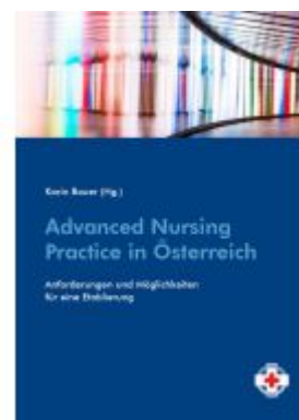
Advanced Nursing Practice in Österreich Ladenpreis: 14,90 EUR