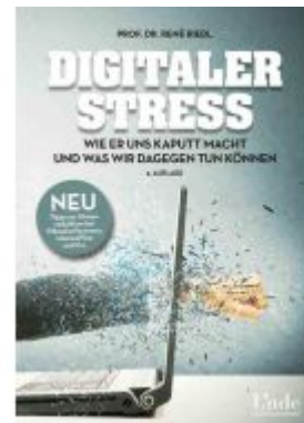
Digitaler Stress Ladenpreis: 22,00 EUR