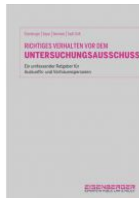
Richtiges Verhalten vor dem Untersuchungsausschuss Ladenpreis: 79,00 EUR