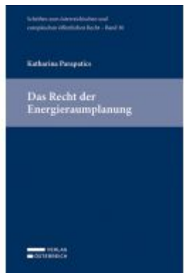
Das Recht der Energieräumplanung Ladenpreis: 109,00 EUR