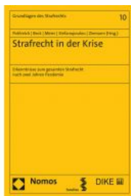
Strafrecht in der Krise Ladenpreis: 70,00 EUR