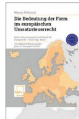
Die Bedeutung der Form im europäischen Umsatzsteuerrecht Ladenpreis: 58,00 EUR