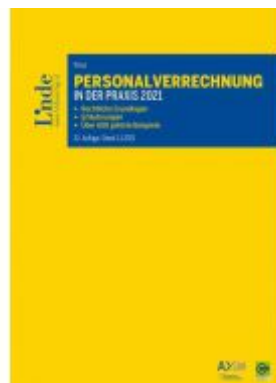
Personalverrechnung in der Praxis 2021 Ladenpreis: 105,00 EUR