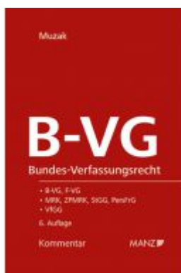
Bundes-Verfassungsrecht B-VG Ladenpreis: 194,00 EUR