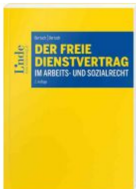
Der freie Dienstvertrag im Arbeits- und Sozialrecht Ladenpreis: 54,00 EUR

Wir haben andere Produkte gefunden, die Ihnen gefallen könnten!