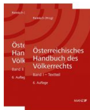
Österreichisches Handbuch des Völkerrechts Ladenpreis: 149,00 EUR