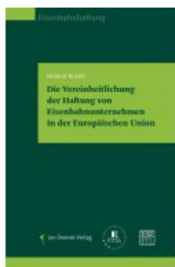
Die Vereinheitlichung der Haftung von Eisenbahnunternehmen in der Europäischen Union Ladenpreis: 59,90 EUR