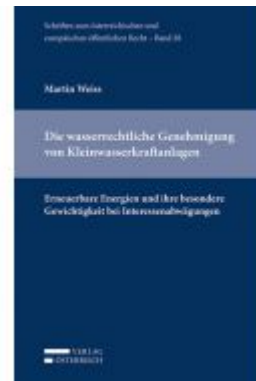
Die wasserrechtliche Genehmigung von Kleinwasserkraftanlagen Ladenpreis: 54,00 EUR