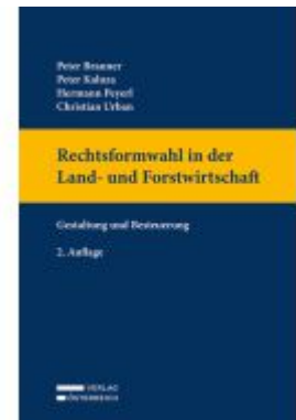
Rechtsformwahl in der Land- und Forstwirtschaft Ladenpreis: 93,00EUR