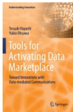
Tools for Activating Data Marketplace Ladenpreis: 175,99EUR