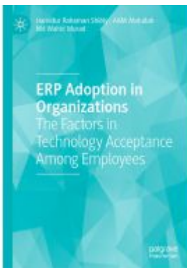
ERP Adoption in Organizations Ladenpreis: 109,99EUR