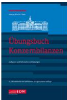
Übungsbuch Konzernbilanzen, 9. Aufl. Ladenpreis: 44,30EUR