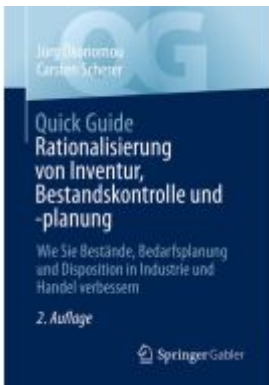
Quick Guide Rationalisierung von Inventur, Bestandskontrolle und -planung Ladenpreis: 25,69EUR