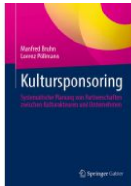
Kultursponsoring Ladenpreis: 102,79EUR