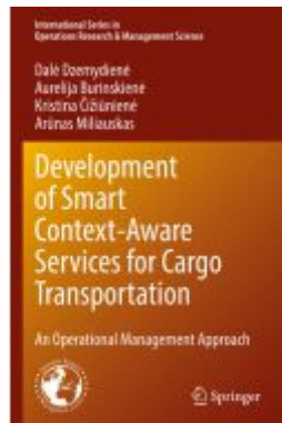
Development of Smart Context-Aware Services for Cargo Transportation Ladenpreis: 109,99EUR