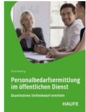
Personalbedarfsermittlung im öffentlichen Dienst Ladenpreis: 51,40EUR