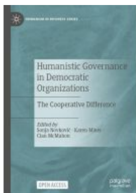
Humanistic Governance in Democratic Organizations Ladenpreis: 54,99EUR