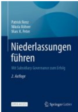
Niederlassungen führen Ladenpreis: 43,99EUR