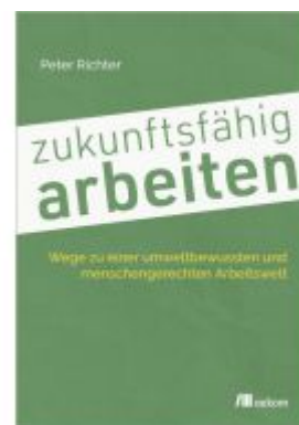
zukunftsfähig arbeiten Ladenpreis: 28,80EUR