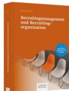
Recruitingmanagement und Recruitingorganisation Ladenpreis: 41,10EUR