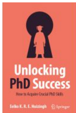
Unlocking PhD Success Ladenpreis: 32,99EUR

Wir haben andere Produkte gefunden, die Ihnen gefallen könnten!