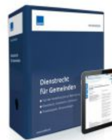
Dienstrecht für Gemeinden Ladenpreis: 228,90 EUR