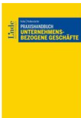
Praxishandbuch Unternehmensbezogene Geschäfte Ladenpreis: 48,00EUR