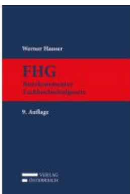
FHG Ladenpreis: 379,00EUR