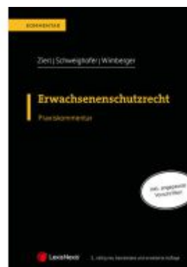
Erwachsenenschutzrecht Ladenpreis: 129,00EUR