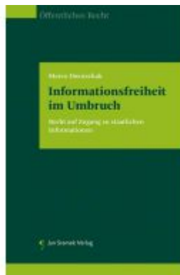
Informationsfreiheit im Umbruch Ladenpreis: 98,00 EUR