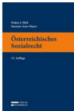
Österreichisches Sozialrecht Ladenpreis: 32,00 EUR