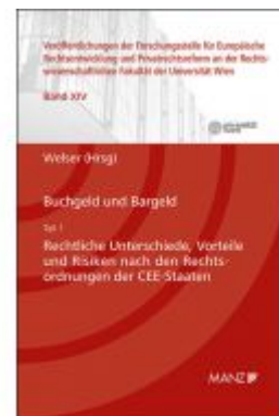
Buchgeld und Bargeld - Teil 1: Rechtliche Unterschiede und Risiken nach den Rechtsordnungen der CEE-Staaten Ladenpreis: 64,00 EUR