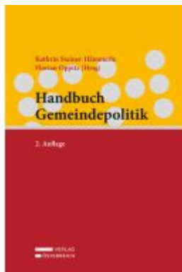
Handbuch Gemeindepolitik Ladenpreis: 68,00EUR