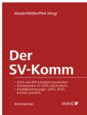
Der SV-Komm Ladenpreis: 398,00 EUR

Wir haben andere Produkte gefunden, die Ihnen gefallen könnten!