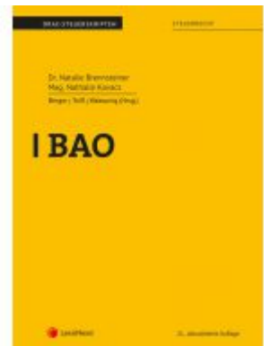
BAO Ladenpreis: 18,00 EUR