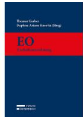
Exekutionsordnung Ladenpreis: 519,00EUR