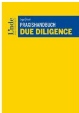
Praxishandbuch Due Diligence Ladenpreis: 68,00EUR