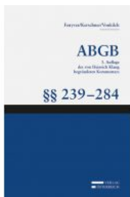
Großkommentar zum ABGB - Klang Kommentar Ladenpreis: 242,00 EUR