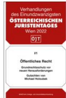
Öffentliches Recht Grundrechtsschutz vor neuen Herausforderungen Ladenpreis: 48,00EUR