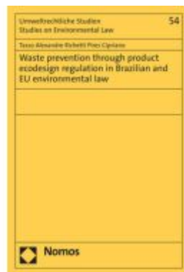
Waste prevention through product ecodesign regulation in Brazilian and EU environmental law Ladenpreis: 96,70EUR