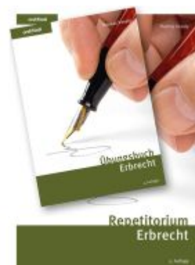
Erbrecht Kombipaket Ladenpreis: 76,10EUR