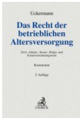
Das Recht der betrieblichen Altersversorgung Ladenpreis: 214,90EUR

Wir haben andere Produkte gefunden, die Ihnen gefallen könnten!