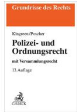
Polizei- und Ordnungsrecht Ladenpreis: 30,70EUR