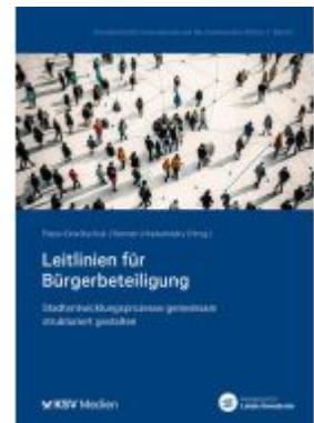
Leitlinien für Bürgerbeteiligung Ladenpreis: 20,60EUR