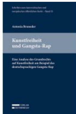
Kunsthfreiheit und Gangsta-Rap Ladenpreis: 54,00EUR