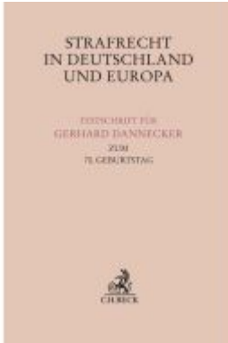
Strafrecht in Deutschland und Europa Ladenpreis: 276,60EUR