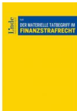
Der materielle Tatbegriff im Finanzstrafrecht Ladenpreis: 62,00 EUR