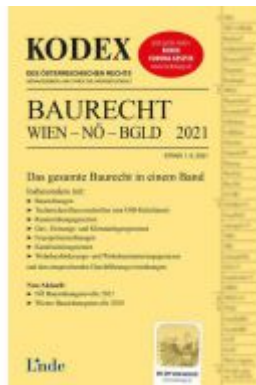
KODEX Baurecht Wien - NÖ - BglD 2021 Ladenpreis: 65,00 EUR