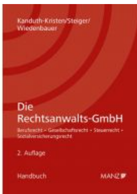
Die Rechtsanwalts-GmbH Ladenpreis: 48,00 EUR