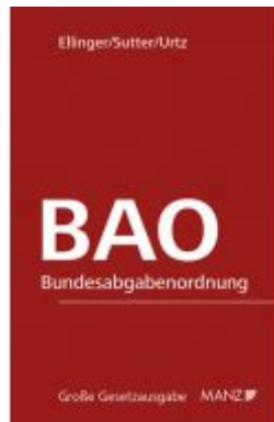
Bundesabgabenordnung - BAO Ladenpreis: 348,00 EUR