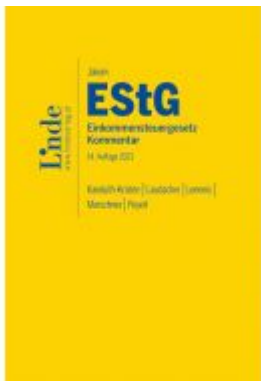
Jakom EStG | Einkommensteuergesetz 2021 Ladenpreis: 140,00 EUR

Wir haben andere Produkte gefunden, die Ihnen gefallen könnten!