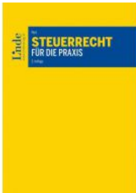
Steuerrecht für die Praxis Ladenpreis: 70,00 EUR