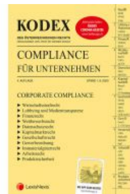
KODEX Compliance für Unternehmen 2020 Ladenpreis: 73,00 EUR