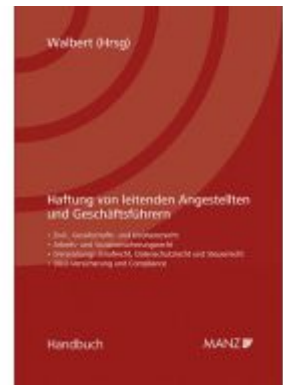
Haftung von leitenden Angestellten und Geschäftsführern Ladenpreis: 98,00 EUR