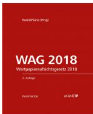
WAG 2018 2.Auflage Wertpapieraufsichtsgesetz 2018 Ladenpreis: 298,00 EUR