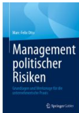
Management politischer Risiken Ladenpreis: 39,06EUR