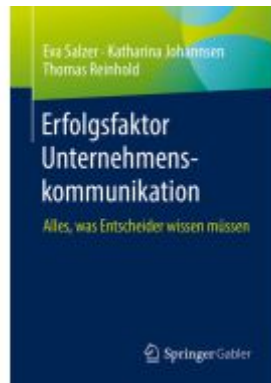
Erfolgsfaktor Unternehmenskommunikation Ladenpreis: 35,97EUR