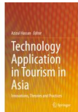
Technology Application in Tourism in Asia Ladenpreis: 197,99EUR