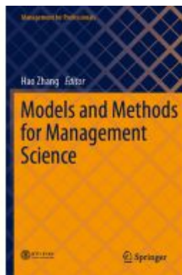
Models and Methods for Management Science Ladenpreis: 131,99EUR