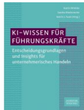
KI-Wissen für Führungskräfte Ladenpreis: 41,20EUR