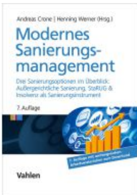
Modernes Sanierungsmanagement Ladenpreis: 81,30EUR

Wir haben andere Produkte gefunden, die Ihnen gefallen könnten!