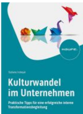
Kulturwandel im Unternehmen Ladenpreis: 46,30EUR