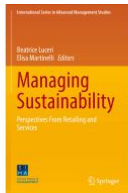
Managing Sustainability Ladenpreis: 109,99EUR