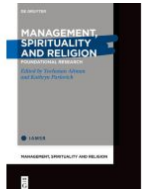
Management, Spirituality and Religion Ladenpreis: 99,95EUR