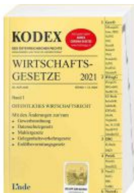
KODEX Wirtschaftsgesetze Band I 2021 Ladenpreis: 59,00 EUR

Wir haben andere Produkte gefunden, die Ihnen gefallen könnten!