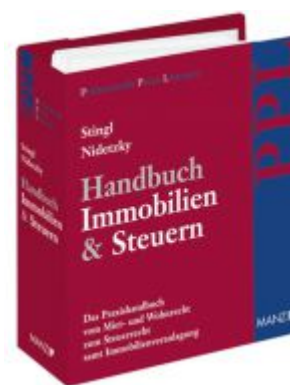
PAKET: Handbuch Immobilien & Steuern Ladenpreis: 278,00 EUR