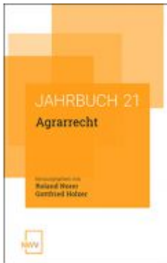
Agrarrecht Ladenpreis: 68,00 EUR