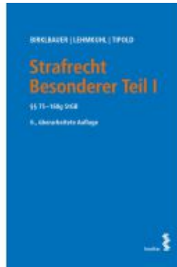
Strafrecht Besonderer Teil I Ladenpreis: 48,00 EUR