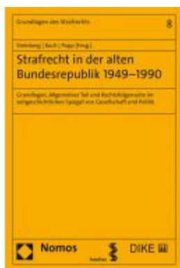
Strafrecht in der alten Bundesrepublik 1949-1990 Ladenpreis: 153,20 EUR