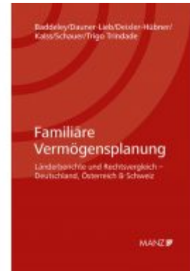
Familiäre Vermögensplanung Ladenpreis: 148,00 EUR