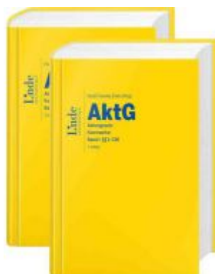
AktG | Aktiengesetz Ladenpreis: 548,00 EUR