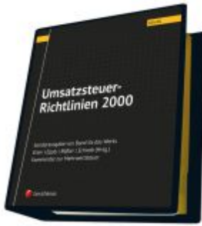
Umsatzsteuer-Richtlinien 2000 Ladenpreis: 155,00 EUR