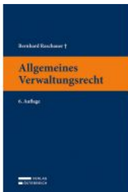
Allgemeines Verwaltungsrecht Ladenpreis: 49,00 EUR