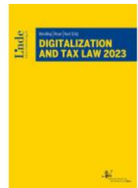
Digitalization And Tax Law 2023 Ladenpreis: 139,00EUR