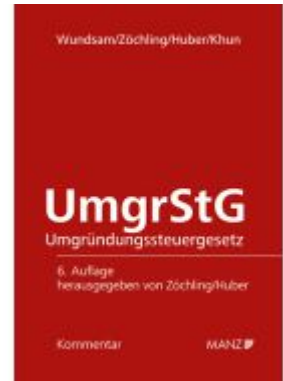
Umgründungssteuergesetz UmgrStG Ladenpreis: 178,00EUR