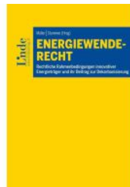
Energiewenderecht Ladenpreis: 89,00EUR