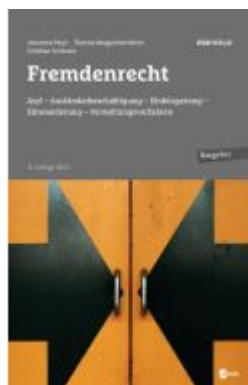
Fremdenrecht Ladenpreis: 39,00EUR