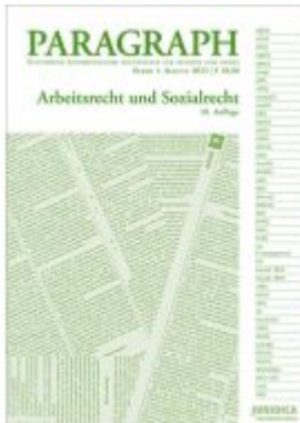
Paragraph - Arbeitsrecht und Sozialrecht Ladenpreis: 18,90EUR

Wir haben andere Produkte gefunden, die Ihnen gefallen könnten!