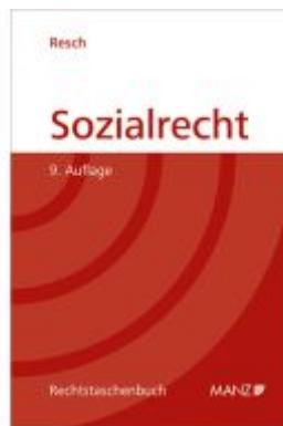
Sozialrecht Ladenpreis: 39,20EUR