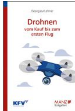
Drohnen - Vom Kauf bis zum ersten Flug Ladenpreis: 23,80EUR