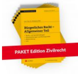
PAKET Edition Zivilrecht PLUS Ladenpreis: 143,00 EUR