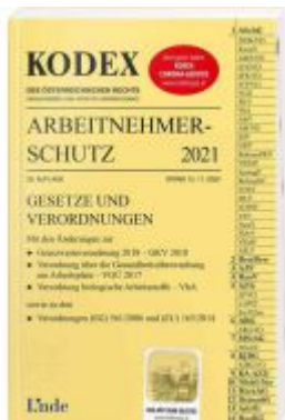
KODEX Arbeitnehmerschutz 2021 Ladenpreis: 37,00 EUR

Wir haben andere Produkte gefunden, die Ihnen gefallen könnten!