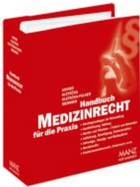
Handbuch Medizinrecht für die Praxis Ladenpreis: 198,00 EUR