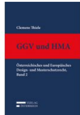
GGV und HMA Ladenpreis: 329,00 EUR