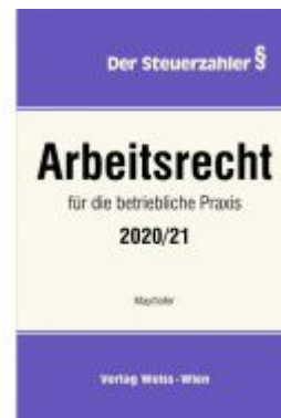
Arbeitsrecht für die betriebliche Praxis 2020/21 Ladenpreis: 85,80 EUR