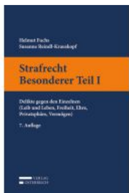
Strafrecht Besonderer Teil I Ladenpreis: 35,00 EUR