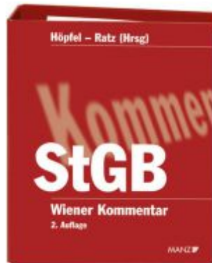
Wiener Kommentar zum Strafgesetzbuch 2. Auflage Ladenpreis: 698,00 EUR