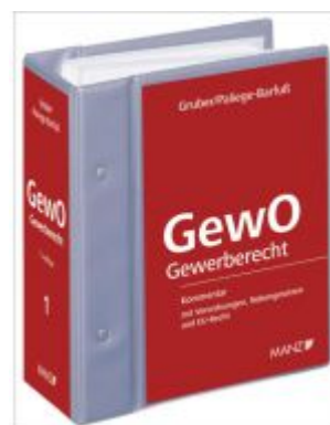
Gewerbeordnung Ladenpreis: 498,00 EUR