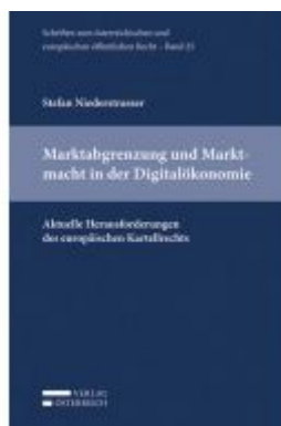
Marktabgrenzung und Marktmacht in der Digitalökonomie Ladenpreis: 49,00 EUR