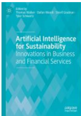
Artificial Intelligence for Sustainability Ladenpreis: 164,99EUR