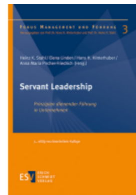
Servant Leadership Ladenpreis: 61,70EUR