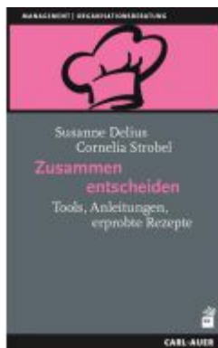
Zusammen entscheiden Ladenpreis: 36,00EUR