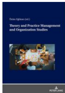
Theory and Practice Management and Organization Studies Ladenpreis: 71,90EUR