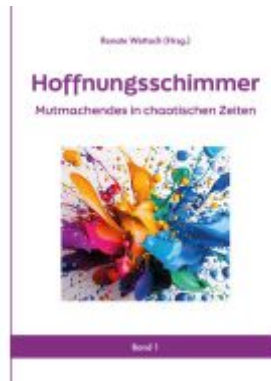
Hoffnungsschimmer Ladenpreis: 20,60EUR