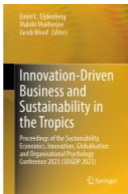
Innovation-Driven Business and Sustainability in the Tropics Ladenpreis: 219,99EUR