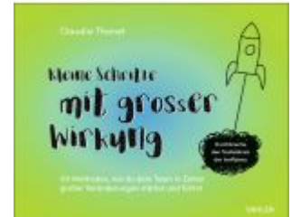
Kleine Schritte mit großer Wirkung Ladenpreis: 35,90EUR