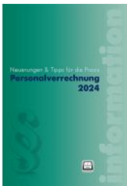
Personalverrechnung 2024 Ladenpreis: 46,00EUR