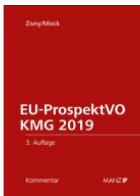
EU-ProspektVO/KMG 2019 Ladenpreis: 148,00EUR