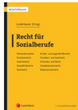
Recht für Sozialberufe Ladenpreis: 69,00EUR