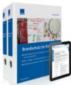
Brandschutz im Betrieb Ladenpreis: 239,80EUR

Wir haben andere Produkte gefunden, die Ihnen gefallen könnten!