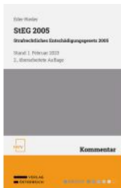
StEG 2005 Strafrechtliches Entschädigungsgesetz 2005 Ladenpreis: 58,00EUR