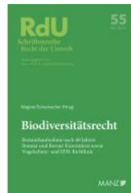
Biodiversitätsrecht Ladenpreis: 58,00EUR