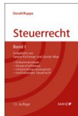
Grundriss des österreichischen Steuerrechts Ladenpreis: 79,00EUR