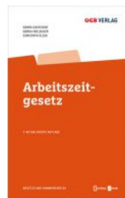
Arbeitszeitgesetz Ladenpreis: 78,00 EUR