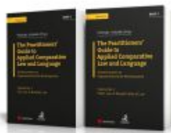
Angloamerikanische Rechtssprache / PAKET: The Practitioners' Guide to Applied Comparative Law and Language Ladenpreis: 142,00 EUR