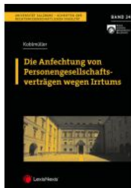
Die Anfechtung von Personengesellschaftsverträgen wegen Irrtums Ladenpreis: 32,00 EUR