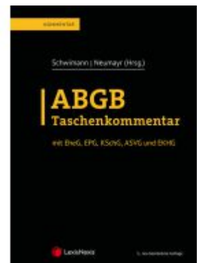
ABGB Taschenkommentar Ladenpreis: 319,00 EUR