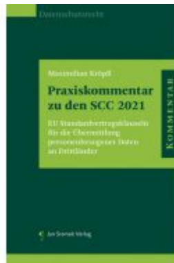
Praxiskommentar zu den SCC 2021 Ladenpreis: 128,00 EUR