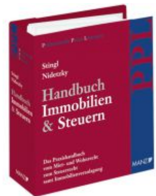
Handbuch Immobilien & Steuern Ladenpreis: 198,00 EUR