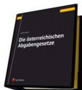
Die österreichischen Abgabengesetze Ladenpreis: 142,00EUR