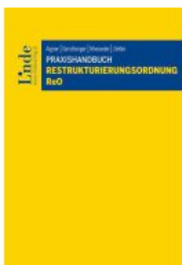
Praxishandbuch Restrukturierungsordnung I ReO Ladenpreis: 76,00EUR