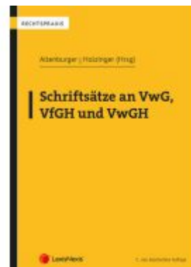
Schriftsätze an VwG, VfGH und VwGH Ladenpreis: 47,00EUR