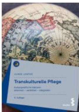
Transkulturelle Pflege Ladenpreis: 26,90EUR