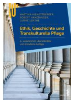
Ethik, Geschichte und Transkulturelle Pflege Ladenpreis: 36,90EUR