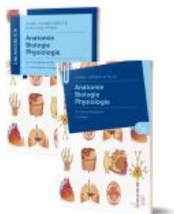
Lernpaket Anatomie, Biologie, Physiologie I Ladenpreis: 56,90EUR