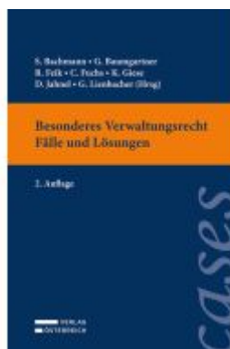
Besonderes Verwaltungsrecht - Fälle und Lösungen Ladenpreis: 33,00EUR