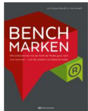
Benchmarks Ladenpreis: 25,70EUR