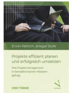
Projekte effizient planen und erfolgreich umsetzen Ladenpreis: 18,00EUR