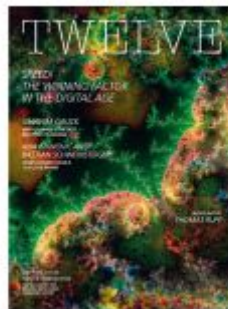
TWELVE 2023 Ladenpreis: 18,50EUR