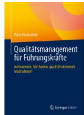
Qualitätsmanagement für Führungskräfte