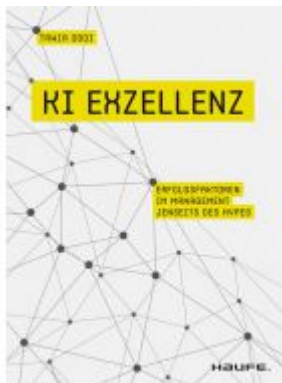
KI Exzellenz Ladenpreis: 30,90EUR