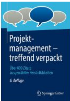
Projektmanagement – treffend verpackt