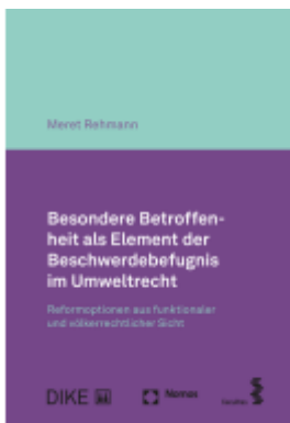
Haupttitel: Besondere Betroffenheit als Element der Beschwerdebefugnis im Umweltrecht Ladenpreis: 117,20EUR