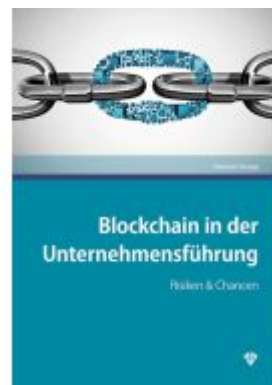
Blockchain in der Unternehmensführung Ladenpreis: 43,00EUR