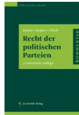
Recht der politischen Parteien