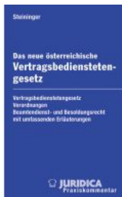
Das neue österreichische Vertragsbedienstetengesetz Ladenpreis: 145,00EUR