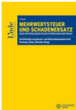
Mehrwertsteuer und Schadenersatz