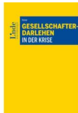
Gesellschafterdarlehen in der Krise