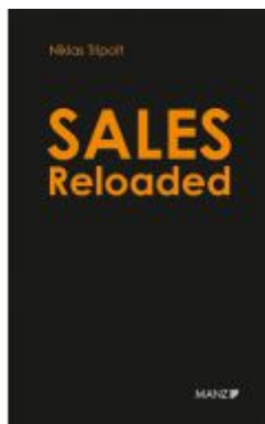
Sales Reloaded Komplexe Projekte in drei Phasen erfolgreich verkaufen Ladenpreis: 24,90EUR