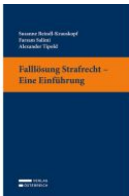
Falllösung Strafrecht - Eine Einführung