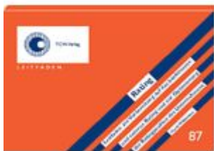
Rating Ladenpreis: 257,10EUR