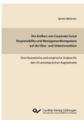
Der Einfluss von Corporate Social Responsibility und Managementkompetenz auf die Über- und Unterinvestition Ladenpreis: 86,20EUR