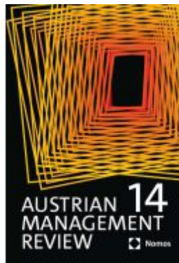
Austrian Management Review Ladenpreis: 45,30EUR