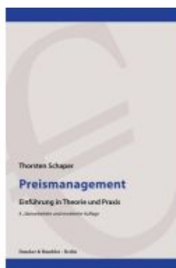
Preismanagement. Ladenpreis: 41,10EUR