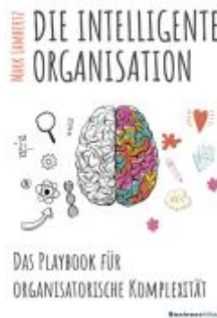
DIE INTELLIGENTE ORGANISATION Ladenpreis: 25,70EUR