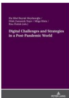
Digital Challenges and Strategies in a Post-Pandemic World Ladenpreis: 72,10EUR