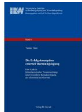
Die Erfolgskonzeption externer Rechnungslegung Ladenpreis: 88,30EUR