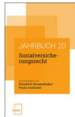
Sozialversicherungsrecht Ladenpreis: 62,00 EUR