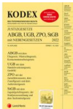
KODEX Justizgesetze 2022 - inkl. App Ladenpreis: 29,00 EUR

Wir haben andere Produkte gefunden, die Ihnen gefallen könnten!