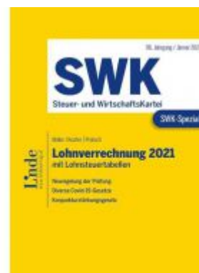
SWK-Spezial Lohnverrechnung 2021 Ladenpreis: 46,00 EUR