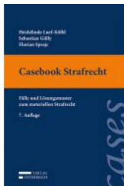
Casebook Strafrecht Ladenpreis: 36,00 EUR