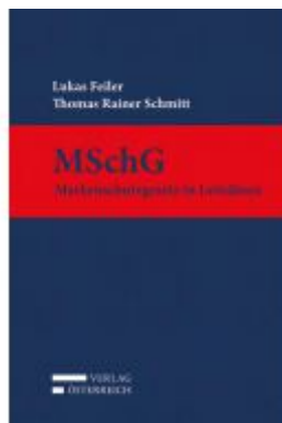
MSchG Ladenpreis: 169,00 EUR