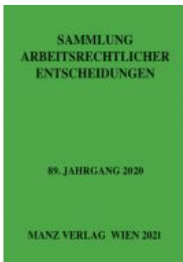
Sammlung arbeitsrechtlicher Entscheidungen Ladenpreis: 96,00 EUR