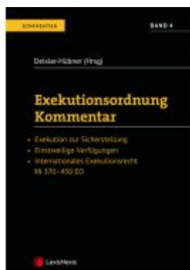
Exekutionsordnung - Kommentar Band 4 Ladenpreis: 128,80 EUR