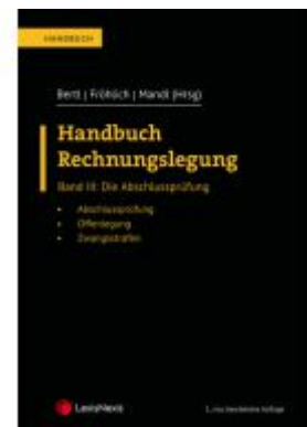
Handbuch Rechnungslegung / Handbuch Rechnungslegung, Band III: Die Abschlussprüfung Ladenpreis: 110,00 EUR