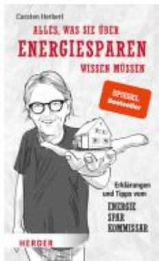
Alles, was Sie über Energiesparen wissen müssen Ladenpreis: 18,60EUR

Wir haben andere Produkte gefunden, die Ihnen gefallen könnten!