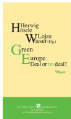
Green Europe Ladenpreis: 21,00EUR