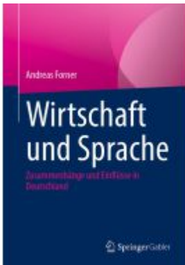
Wirtschaft und Sprache Ladenpreis: 61,68EUR