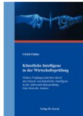
Künstliche Intelligenz in der Wirtschaftsprüfung Ladenpreis: 67,70EUR