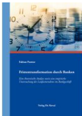
Fristentransformation durch Banken Ladenpreis: 91,40EUR