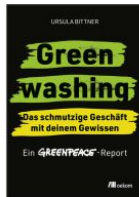
Greenwashing – das schmutzige Geschäft mit deinem Gewissen Ladenpreis: 24,70EUR