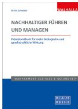
Nachhaltiger führen und managen Ladenpreis: 36,00EUR