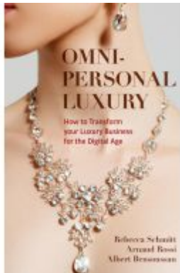
Omni-personal Luxury Ladenpreis: 49,49EUR