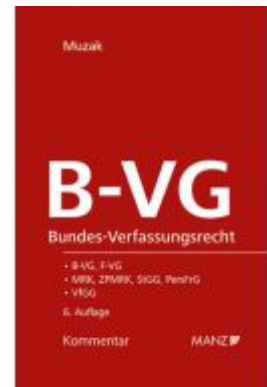
Bundes-Verfassungsrecht B-VG Ladenpreis: 194,00 EUR