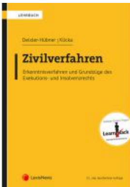
Zivilverfahren Ladenpreis: 64,00 EUR