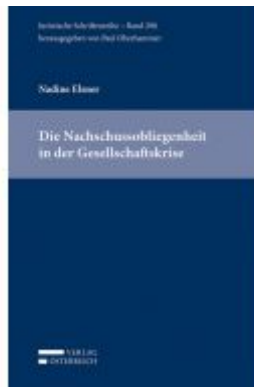
Die Nachschussobligation in der Gesellschaftskrise Ladenpreis: 79,00 EUR