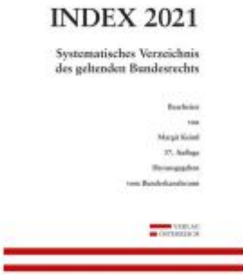
Index Bundesrecht 2021 Ladenpreis: 179,00 EUR