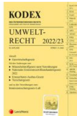
KODEX Umweltrecht 2022/23 - inkl. App Ladenpreis: 109,00 EUR