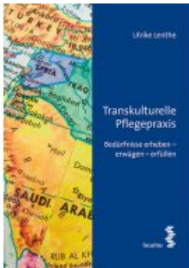
Transkulturelle Pflegepraxis Ladenpreis: 9,90 EUR