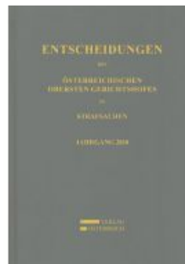
Entscheidungen des Österreichischen Obersten Gerichtshofes in Strafsachen Ladenpreis: 164,00 EUR