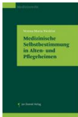
Medizinische Selbstbestimmung in Alten- und Pflegeheimen Ladenpreis: 85,00 EUR