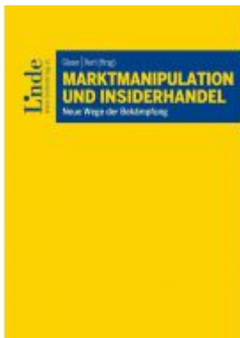
Marktmanipulation und Insiderhandel Ladenpreis: 28,00 EUR

Wir haben andere Produkte gefunden, die Ihnen gefallen könnten!