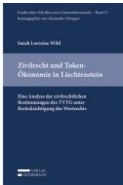
Zivilrecht und Token-Ökonomie in Liechtenstein Ladenpreis: 39,00 EUR