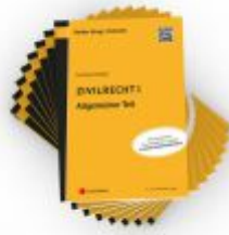
PAKET Lehrbuchreihe Zivilrecht I - VIII Ladenpreis: 250,00 EUR