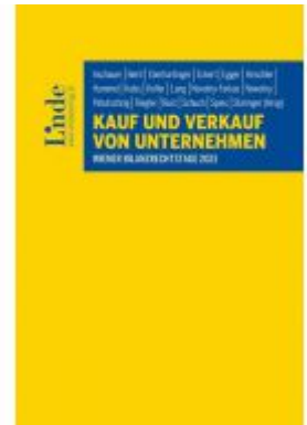
Kauf und Verkauf von Unternehmen Ladenpreis: 68,00 EUR