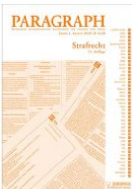
Paragraph - Strafrecht Ladenpreis: 14,90 EUR