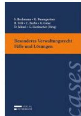
Besonderes Verwaltungsrecht - Fälle und Lösungen Ladenpreis: 33,00 EUR