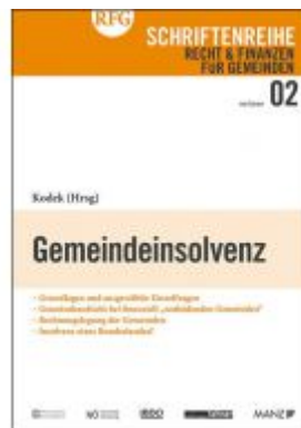
Gemeindeinsolvenz Ladenpreis: 24,00 EUR