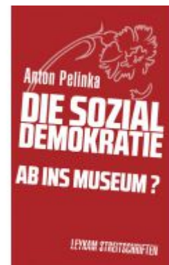
Die Sozialdemokratie – ab ins Museum? Ladenpreis: 12,50 EUR