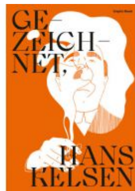
Gezeichnet, Hans Kelsen Ladenpreis: 19,00 EUR