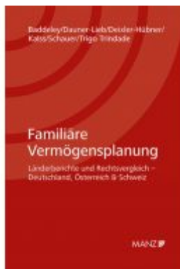
Familiäre Vermögensplanung Ladenpreis: 148,00 EUR