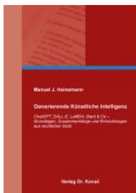
Generierende Künstliche Intelligenz Ladenpreis: 101,60EUR