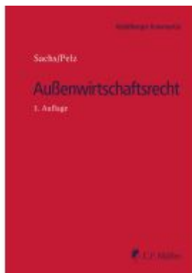
Außenwirtschaftsrecht Ladenpreis: 168,60EUR