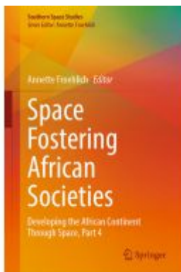
Space Fostering African Societies Ladenpreis: 164,99EUR