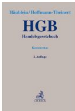
Handelsgesetzbuch Ladenpreis: 204,60EUR