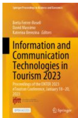
Information and Communication Technologies in Tourism 2023 Ladenpreis: 43,99EUR