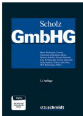
GmbH-Gesetz, Band II Ladenpreis: 245,70EUR

Wir haben andere Produkte gefunden, die Ihnen gefallen könnten!