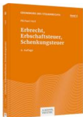
Erbrecht, Erbschaftsteuer, Schenkungssteuer Ladenpreis: 41,10EUR